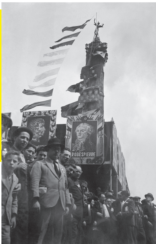
Colonne de Juillet ; Défilé de la victoire du Front populaire, place de la Bastille, Paris, 14 juillet 1936 ; [Colonne de la Bastille décorée]