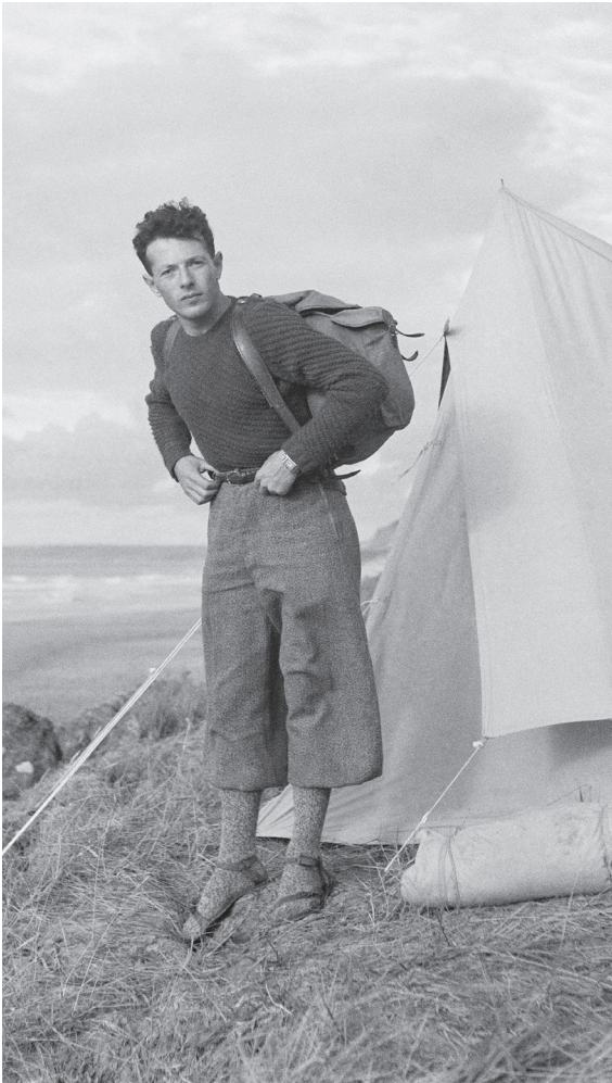
Autoportrait, 1937 ; [Camping]

Dans le cadre de sa saison culturelle 2025/2026, la Ville de Tarnos explore le thème "Résistance et engagements". À travers ce choix, elle souhaite faire résonner les enjeux sociétaux contemporains avec des commémorations historiques, parmi lesquelles les 90 ans du Front Populaire. Tarnos consacre ainsi une exposition au photographe Willy Ronis intitulé "Le temps conquis : commémorer le Front populaire avec Willy Ronis".