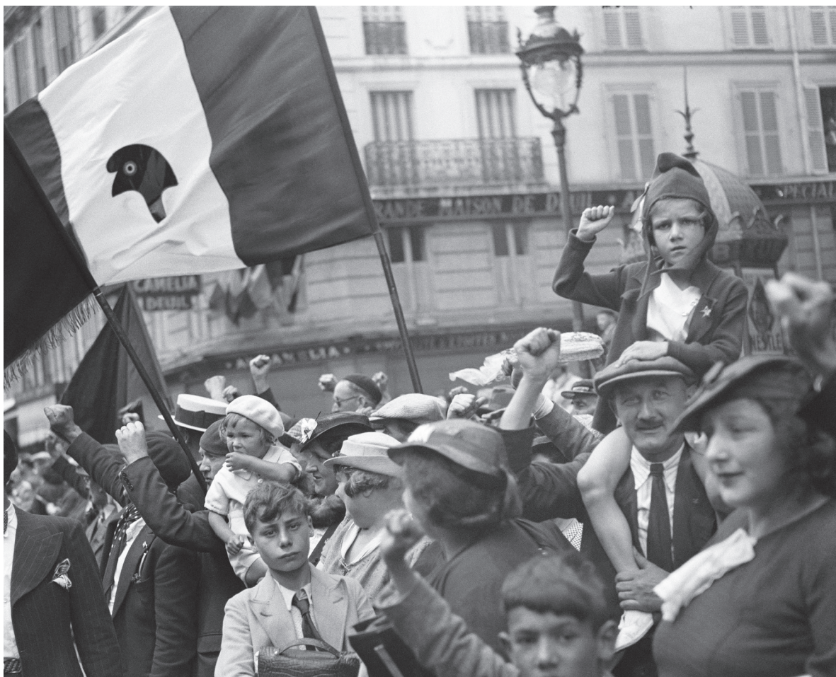
Pendant le défilé de la victoire du Front populaire, rue Saint-Antoine, Paris, 14 juillet 1936 ; [Drapeaux et enfant au poing levé]

Près de 60 photographies, dont certaines inédites, seront présentées. Elles permettront de retracer à la fois l'histoire sociale du Front Populaire et les débuts de Willy Ronis".